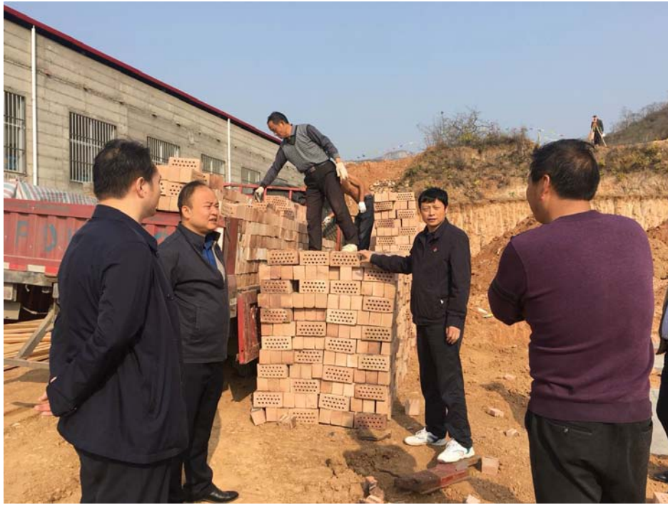
考察调研朱沟村扶贫安置小区建设进展情况