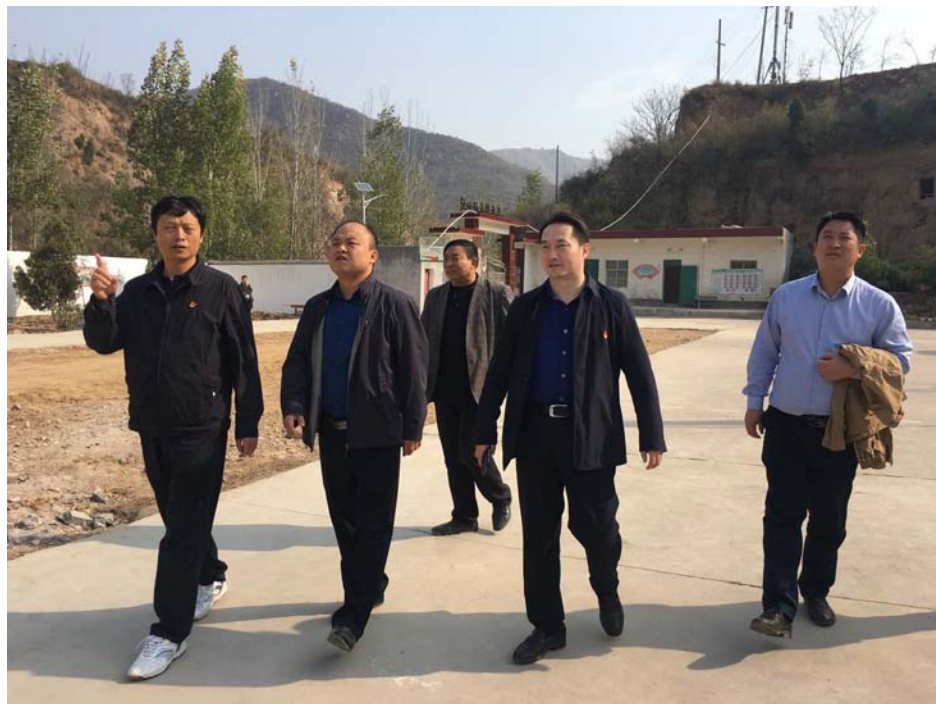
考察调研朱沟小学寄宿宿舍建设情况