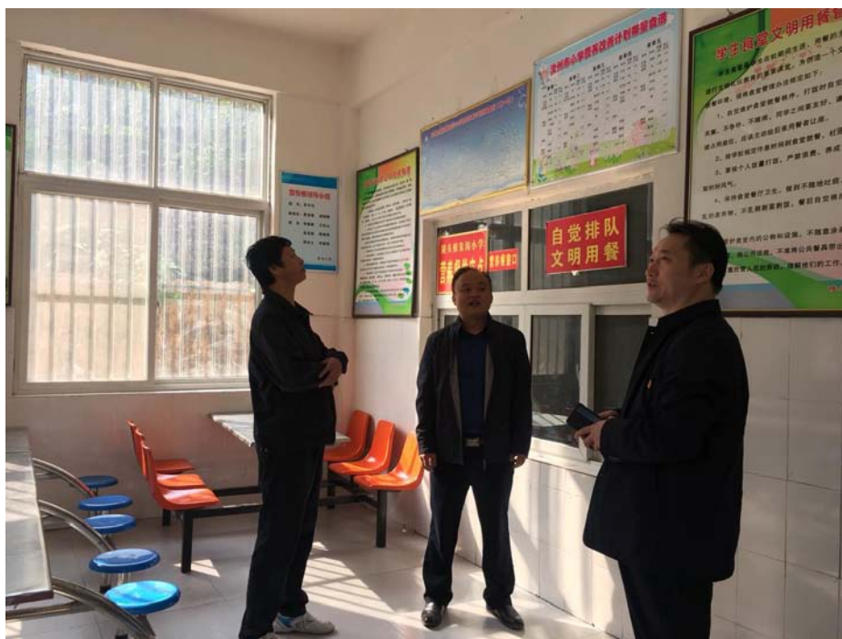
考察调研朱沟小学营养餐饮工程实施情况