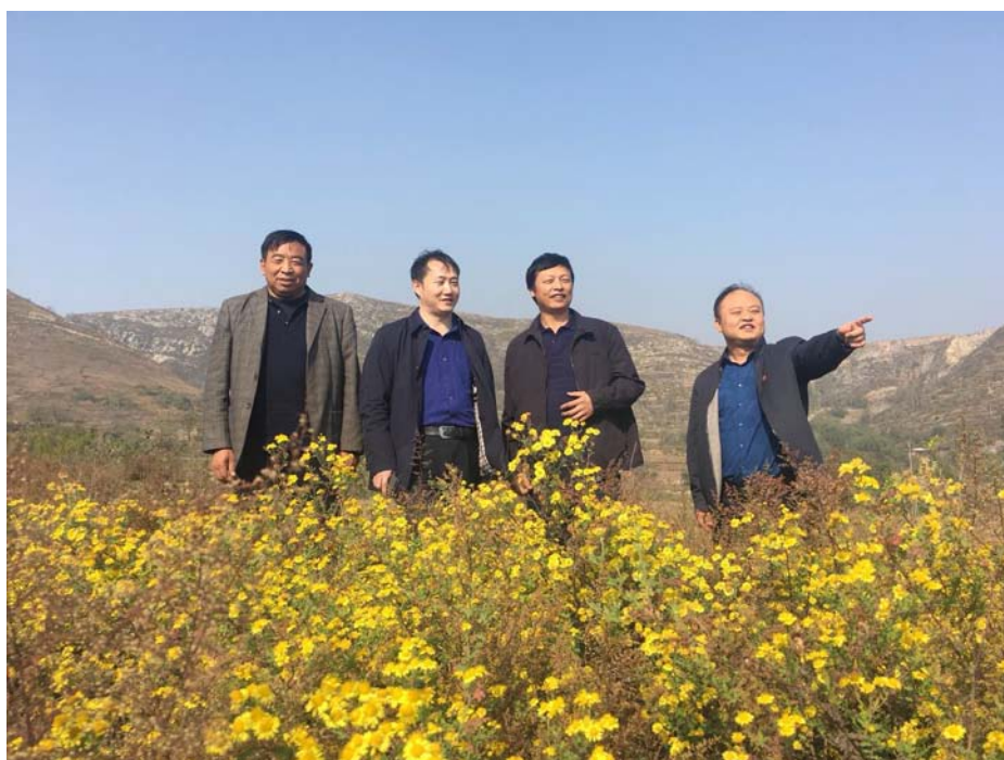
考察调研花椒基地建设情况